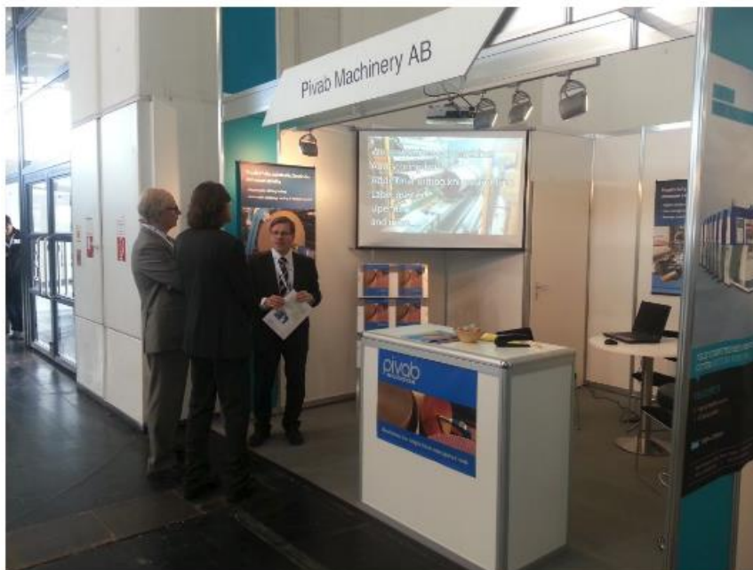
Pivab Machinery syns i år på CCE International i München för andra gången.

Bara tre svenska företag syns på årets CCE-mässa i mars. Pivab Machinery i Kolmården är ett av dem.